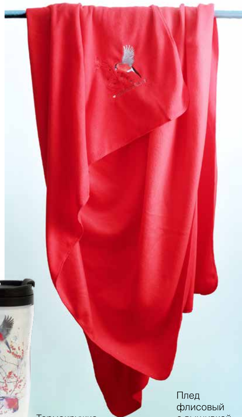
Плед флисовый с вышивкой